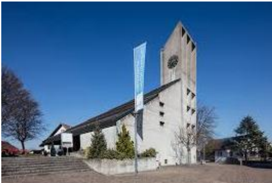
Evangelisch-reformierte Kirchgemeinde, Rümplangstrasse 5, 8154 Oberglatt Tel. 044 850 20 15, sekretariat@kircheoberglatt.ch , www.kircheoberglatt.ch